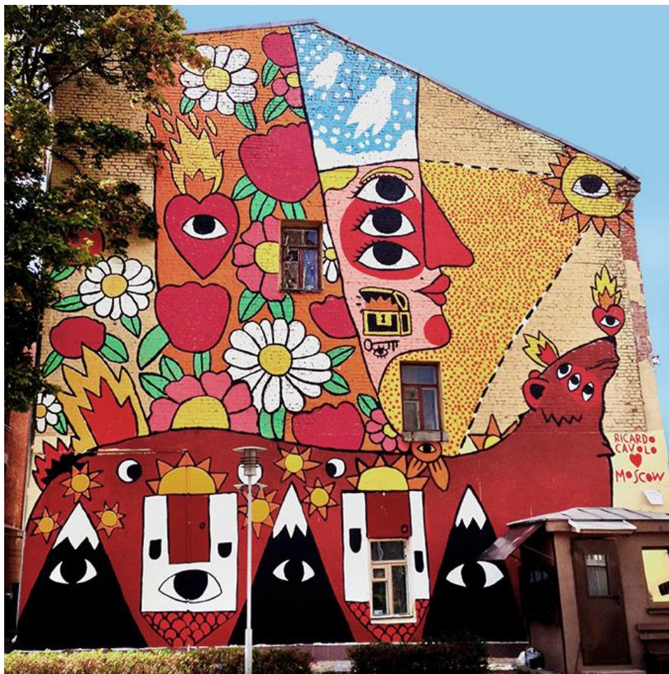
Intervención de Ricardo Cávolo en Moscú. Fuente: Ricardo Cávolo