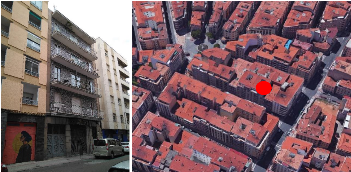
Fachada a intervenir y entorno urbano.